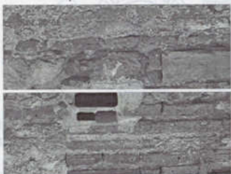
Reducción al 25% del hueco del mechina para nido de cernícalos

que imposibiliten espacial y físicamente la nidificación de palomos y favorezcan la de cernícalos primillas.