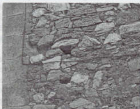
Abundantes huecos, ahora innecesarios