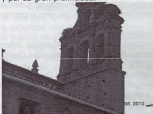
España oeste con mechinales

Las palomas, en gran exceso y amparadas por la inaccesibilidad de los numerosos monumentos de la ciudad y de la alimentación fácil de las producciones agrarias del entorno, son aves casi parásitas que deterioran los edificios con los restos de los nidos, por sus heces y por su gran prolificidad.