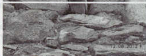
Huecos amplios, ideales para la cría de palomas