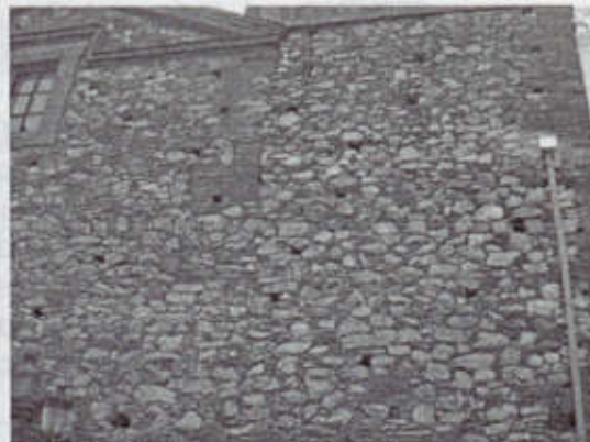
Fachada C/ Bodegones con 50 mechinales