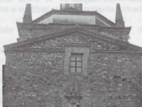
Fachada Plaza de Los Ajos, ya restaurada pero sin huecos en la parte inferior